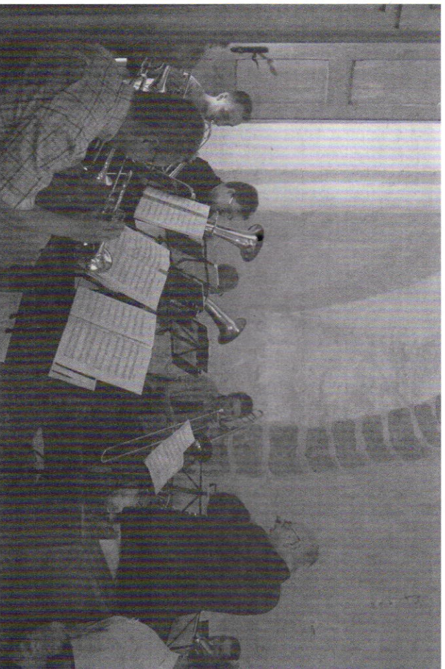
Musik ganz anderer Art.