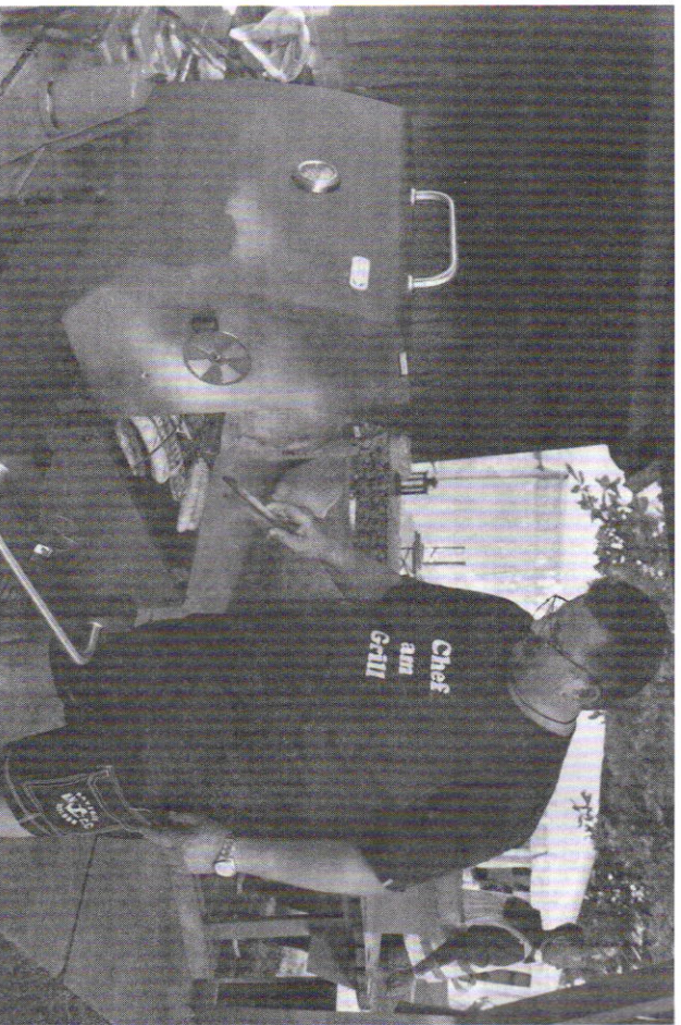
Grillgutvorbereitung zur Band.