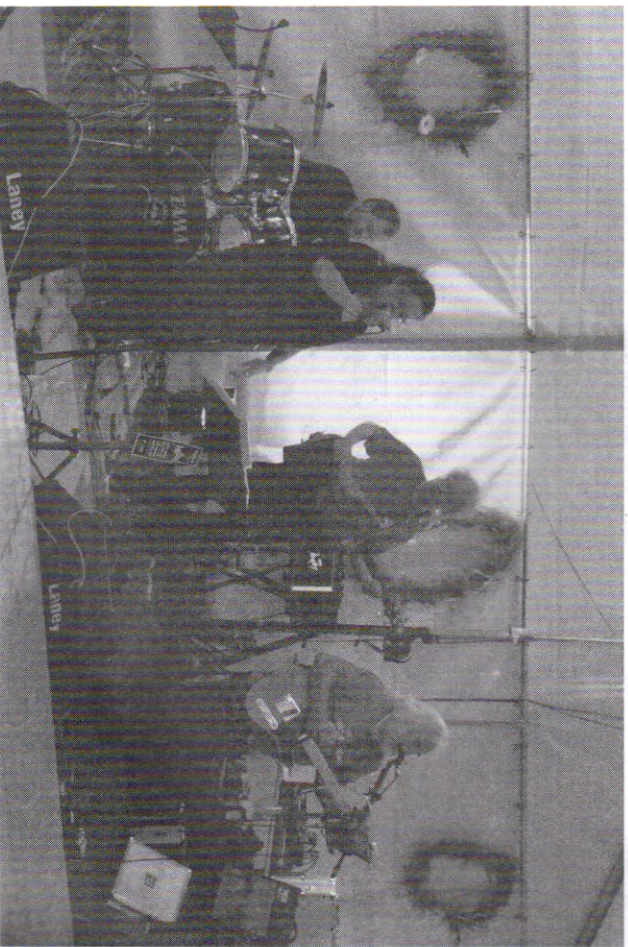
Die Band „Um Himmels Willen“ spielt auf.